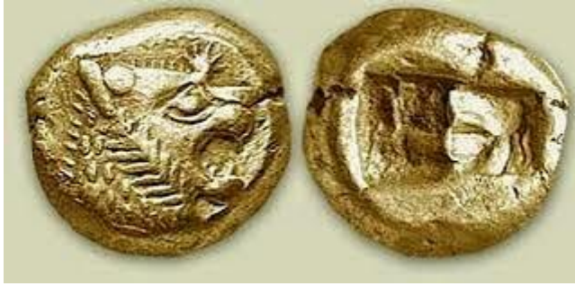
Figure 1: The Lydian Lion